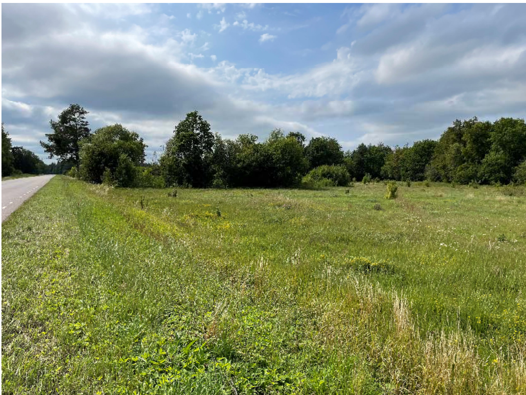
Foto 1. Vaade planeeritavale alale idanurgast, Kuusalu-Leesi maanteelt.

Planeeritavat ala ei läbi insenerivõrgud.