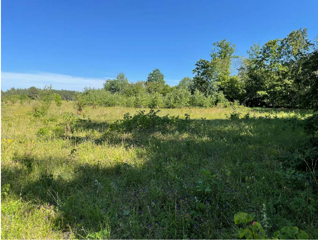
Foto 2. Vaade kavandatavale hoonestusalale loodest, Mäekallaku maaüksuselt.

Looduskaitsealuseid objekte ja riiklikult kaitstavaid kinnismälestisi planeeringualal ei leidu.