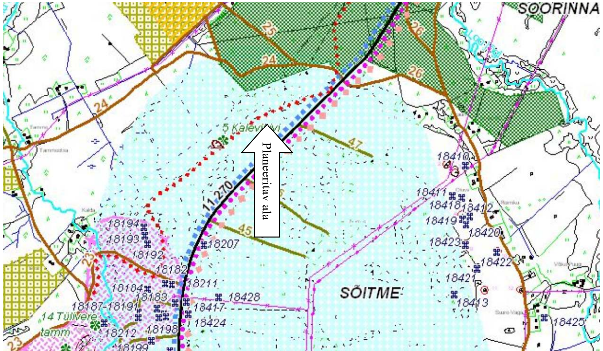
Joonis 2. Väljavõte Kuusalu valla üldplaneeringust